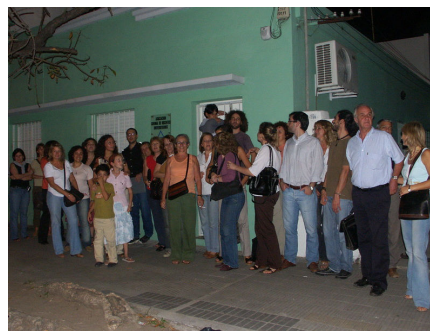
Nutrida Asamblea en la vereda de AGDU